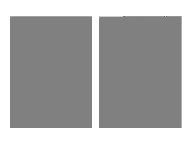
Отбор смыва для люминометрии

Если контролируемый объект имеет неровности или меньшие габариты, то пробу отбирают либо со всей его поверхности, либо с как можно большей площади.