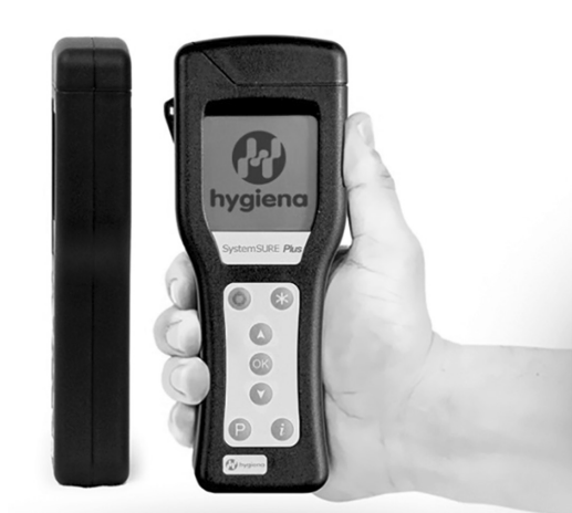
РИСУНОК 1. АТФ-ЛЮМИНОМЕТР HYGIENA МОДЕЛИ SYSTEMSURE PLUS

бактериальных, а также обнаруживается в различных органических субстратах, включая биологические жидкости пациентов, такие как кровь, слюна, испражнения.